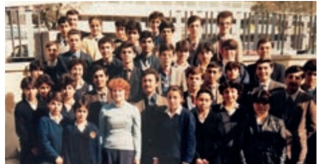
1984-85 dönemi 6E mezuniyet öncesi

"Taşı delen suyun gücü değil, damlaların sürekliliğidir!" Yarınlar için siz gençlere umudum tamdır. Hoşça kalın, sevgilerle kalın.