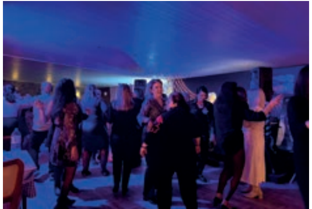
Davetlilerimiz danslarıyla gecemizi renklendirdiler